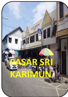
PASAR SRI KARIMUN