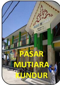
PASAR MUTIARA KUNDUR