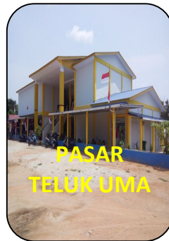
PASAR TELUK UMA